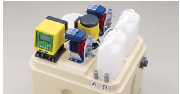
ミキサーを中央に設置し槽内の攪拌効率をアップさせました。