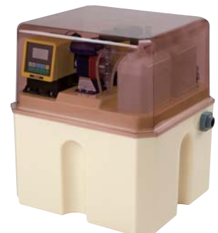
オプションのスモークカバーを付けた外観

商品のお問い合わせは、直通ダイヤルの tel 03-3946-3033 におかけください。