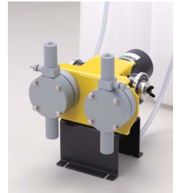
肥料注入用ダイヤフラム定量ポンプ